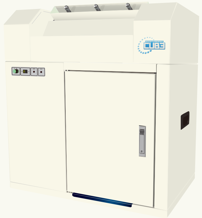
モイスターミストは当社の商標登録です。